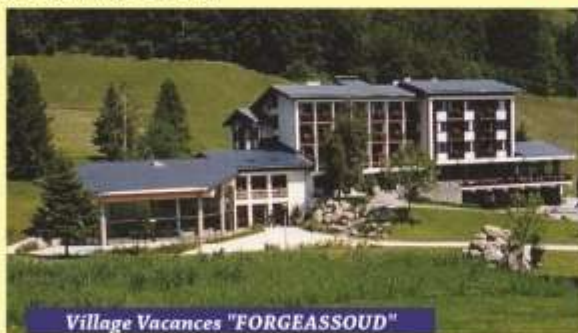
Village Vacances "FORGEASSOUD"

Le village vacances A.E.C. "FORGEASSOUD" est situé sur la commune de St Jean de Sixt (Haute Savoie), au cœur du massif alpin des Aravis. Le climat est de type montagnard. St Jean de Sixt se situe à 3 km de La Clusaz et du Grand-Bornand. Découvrez des sites naturels prestigieux et chargés d'histoire, et de nombreuses traditions Savoyardes. Le village vacances est à 1km du centre du village de St Jean de Sixt.