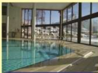
Piscine couverte et chauffée