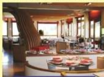
Salle de restaurant