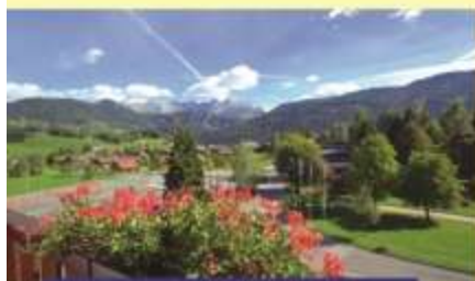
Vue sur la chaîne des Aravis

Pour la danse : Salle d'animation avec sol parquet pour les stages et soirées